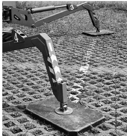
2 Hubarbeitsbühnen mit Stützen müssen auf unbefestigten Böden auf Unterlegplatten abgestützt werden.