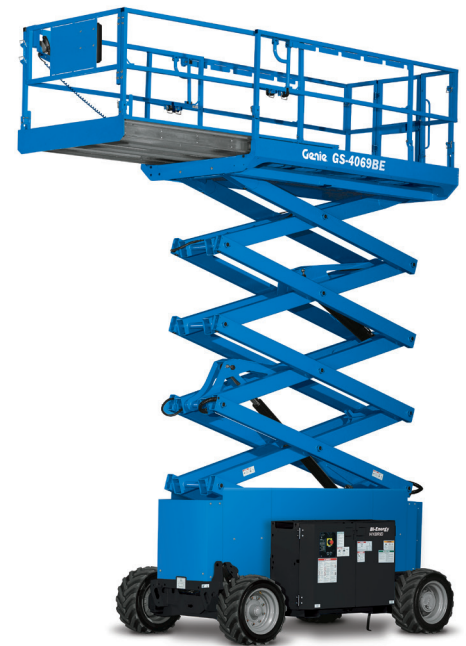
03/17 Ersatzteil Nr. B127304DE